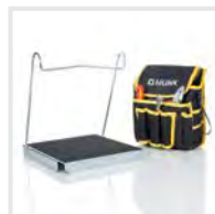
Sicherer Stand Bestell-Nr. 19324

Neben Sets für einen sicheren Stand, gibt es auch Pakete mit praktischen Helfern oder zur Erfüllung der TRBS.