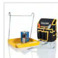
Praktische Helfer 1 Bestell-Nr. 19327