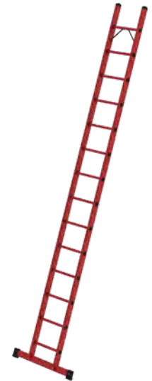
Abb. Bestell-Nr. 36814

mit rutschsicheren Leiterschuh (liegt ab Leiterlänge 3,0 m lose bei)