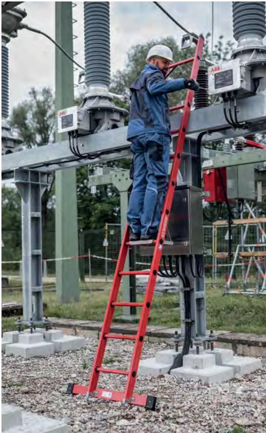
Abb. Bestell-Nr. 36812 mit Bestell-Nr. 19910