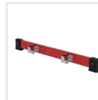
Nachrüst-Traverse Bestell-Nr. 30373