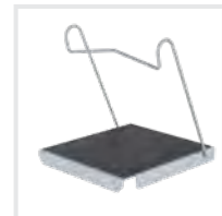
Einhängetritt R 13 Bestell-Nr. 19910